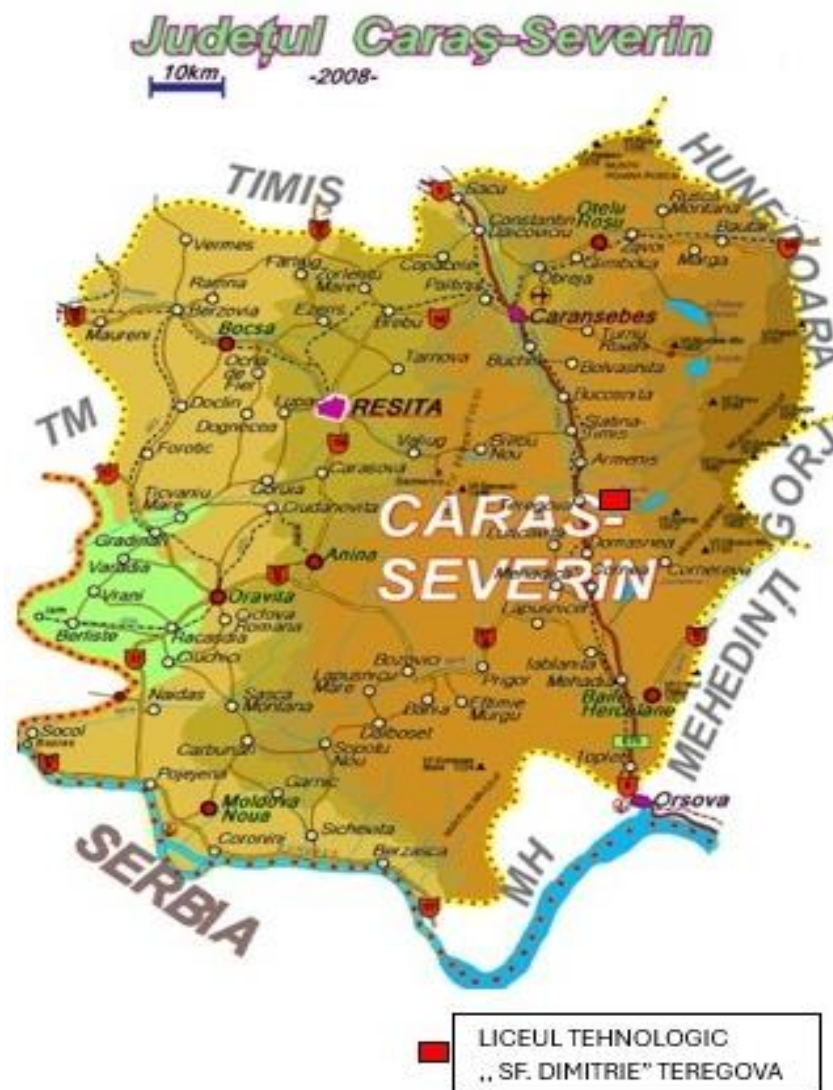
Harta județului Caras-Severin